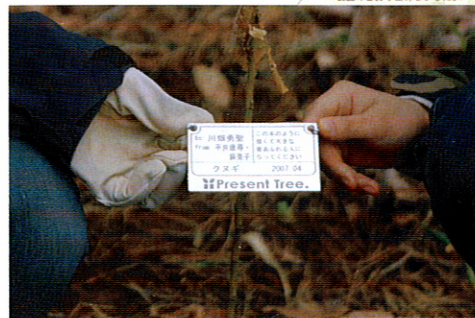
植樹につけるプレート例 樹の管理番号