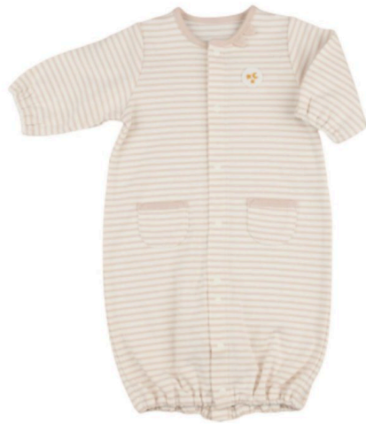
オーガニックコットンを使用した長袖ドレスオール（50～60cm）1,980円。