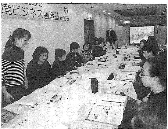
自身が取り組む活動などを説明しながら自己紹介する参加者

女性のための環境ビジネス創造塾in釜石は16日、釜石市大町の釜石ベイシティホテルで開かれた。環境省の開催地募集に市が応募して実現したもので、さまざまな分野で活動する釜石・大槌地区の女性16人が参加。講師として「環境ビジネスウイメン」5人の派遣を受け、新たなビジネス展開のヒントを学んだ。