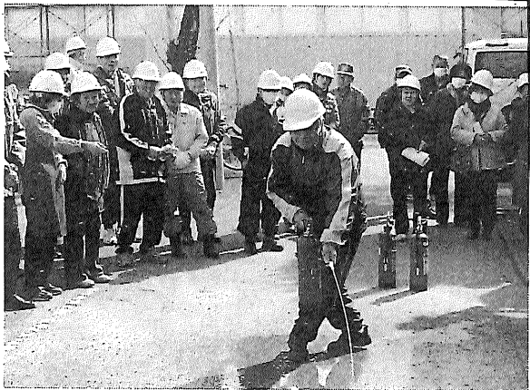
例年より多くの住民が参加した小川町内会の防災訓練